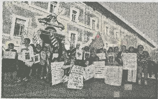
Protesta Una manifestazione dei lavoratori Asp.

■ La loro preoccupazione è che venga messo in discussione l'equilibrio raggiunto tra pubblico e privato nella gestione dei servizi agli anziani erogati dall'Asp di Fidenza. Questo ad appena un anno di distanza dall'accordo distrettuale sui fabbisogni socio-sanitari e dall'accreditamento. Cgil, Cisl e Uil lo hanno ribadito in una conferenza stampa nella sede della Cisl, a seguito di un recente incontro con il comitato di Distretto di Fidenza, su loro richiesta.