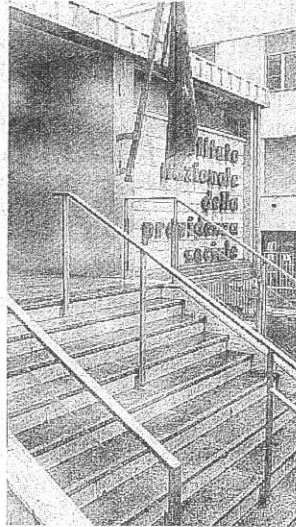
La sede Inps di Parma