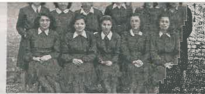
Anno 1947 Un gruppo di maestrae borghigiane neodyplomatice.

Perché una festa dedicata ai maestri? Lo spiega la storica