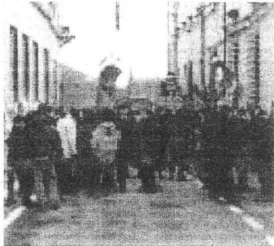
La protesta a Bologna; a destra lo stabilimento di San Quirico

I eri a Bologna si è tenuta la manifestazione dei lavoratori del settore bieticolo che hanno scelto di protestare per la questione degli ammortizzatori sociali e per il mantenimento produttivo dello stabilimento di San Quirico. Provenienti da ogni parte d'Italia i tantissimi i lavoratori che hanno deciso di aderire alla protesta. L'azienda dichiara che la decisione di non rinnovare gli accordi scaduti a fine anno trae origine dagli inadempimenti delle istituzioni locali che non hanno ancora emanato i provvedimenti necessari al concreto avvio di progetti finalizzati alla realizzazione dei nuovi impianti di produzione di energia da fonti rinnovabili di origine