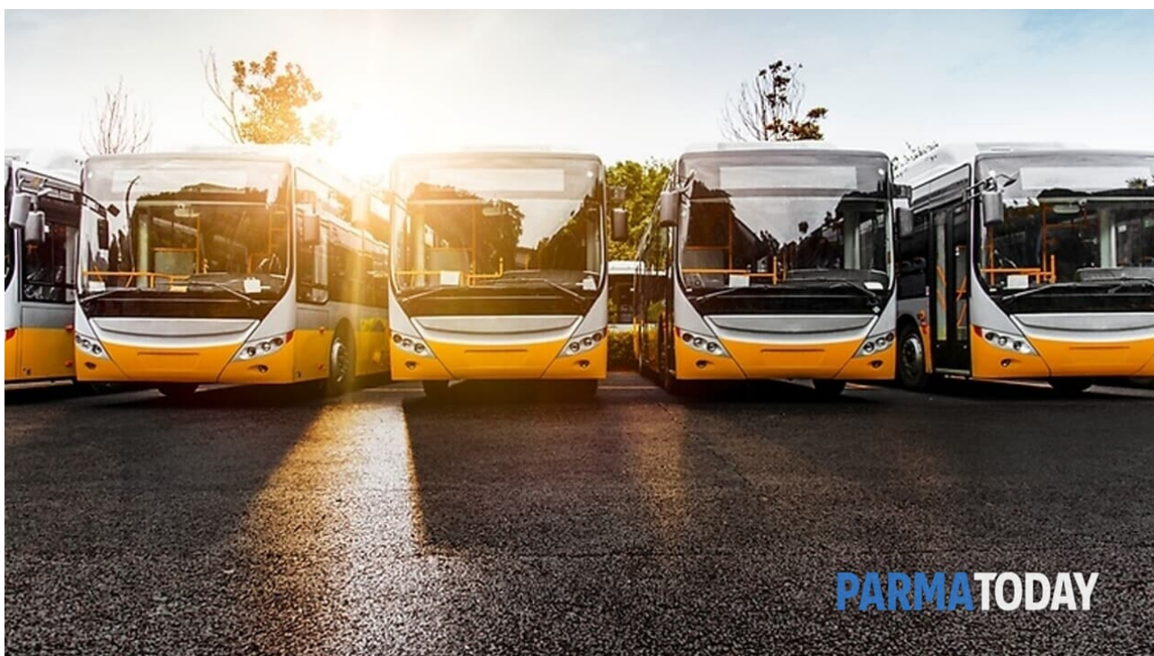
Immagine di repertorio

Filt Cgil, Fit Cisl, Uiltrasporti, Faisa Cisl e Ugl Autoferro indicano 8 ore di stop a causa "delle reiterate aggressioni a conducenti, controllori, capistazione, addetti a traghetti e vaporetti, registrate su tutto il territorio nazionale negli ultimi mesi"