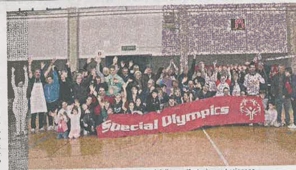
Special Olympics Foto di gruppo per i partecipanti della manifestazione a Lesignano.