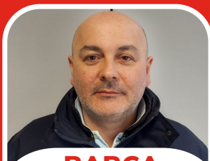
BARCA NAZARENO Personale viaggiante