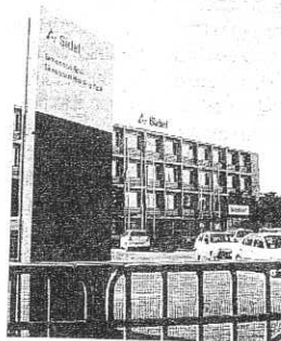
Sidel di via la Spezia

In ginocchio le terme di Salsomaggiore, di cui i sindacati lamentano il fatto che se ne parli ancora troppo poco: «Calano i clienti, non ci sono i soldi, servono ammo-