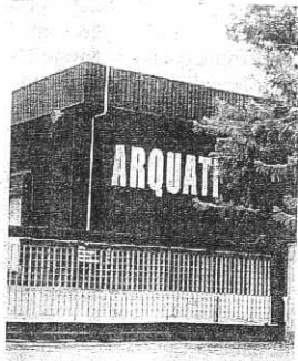
Arquati di Sala Baganza

La Provincia ha aperto 19 tavoli sull'intero territorio per cercare di salvare realtà produttive e posti di lavoro. In sette mesi sono stati coinvolti in trattative Emiliana Conserva, Spx, Arquati, Co. Far. Pa., Comparto motorini elettrici, Gruppo Ceriani, N. O. V. srl, Lockwoods spa, Raytec Vision spa, Sidel, Simonazzi, Telecom Italia, Nestlé, Matthews, Bormioli Rocco & figlio spa, Battioni e Pagani, Fincuoghi spa, Battistero, Foods Drying e Marchelli metalli.