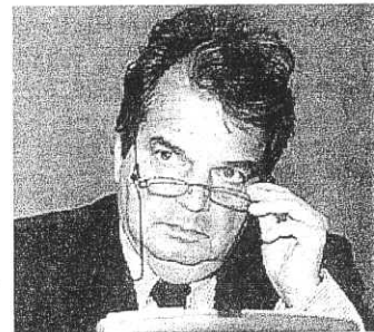
Il ministro Renato Brunetta

tamente hanno fatto discutere per l'idea e la creazione di tornelli al Duc per veicolare l'accesso dei dipenden-