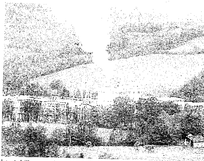
Lo stabilimento della Fincuoghi, simbolo della crisi in Valtaro

La manifestazione inizierà alle 9.30, con il raduno dei partecipanti del capoluogo valtarese presso lo stabilimento Fincuoghi, nella zona industriale.