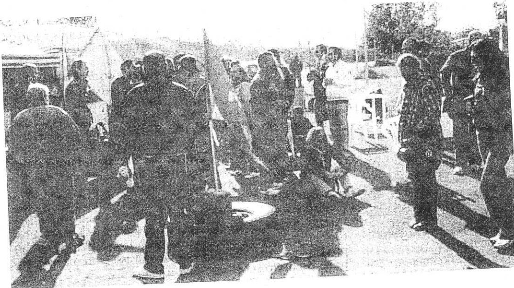
Il presidio davanti alla Spx