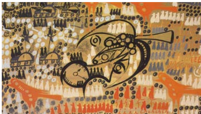
Coop. Soc. Cabiria - Parma